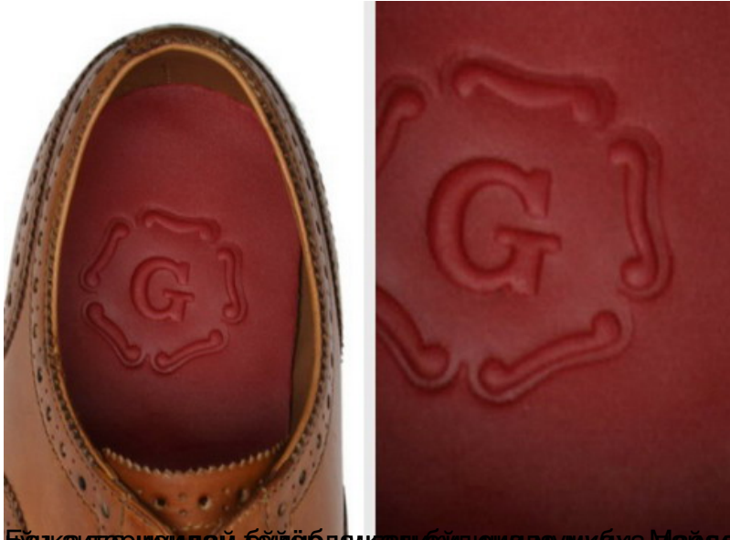
бу, лад. Цуфдасюжабиол, туфли